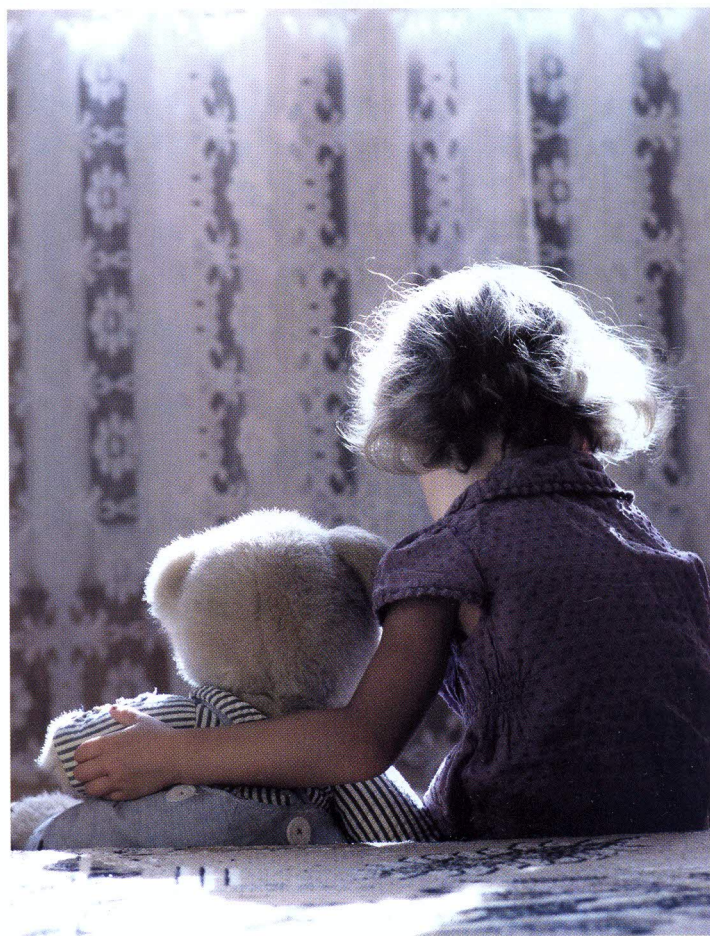
Fotos: ambrozino, fotojacobi; Illustration: toropova1964/alle Fotolia

Das ist natürlich eine Straftat, ethisch und juristisch untragbar. Aber psychodynamisch erklärbar.